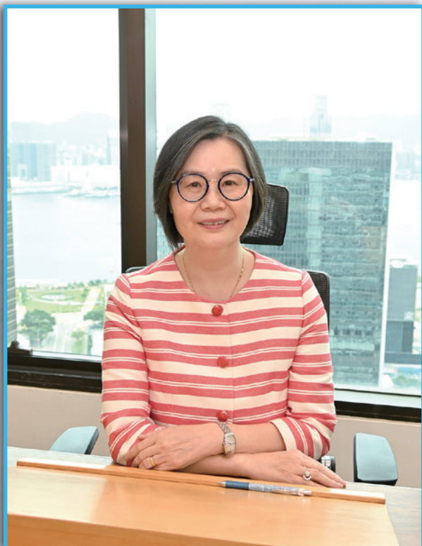
毛旭华女士 法律援助署副署长 (诉讼)