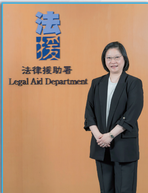
姜美全女士 法律援助署助理署长 (诉讼)